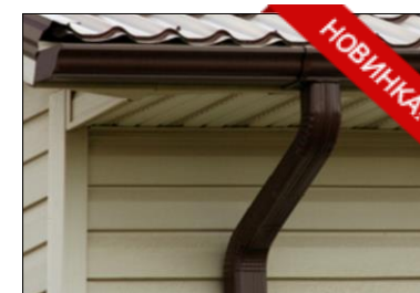
Водосточная система прямоугольного сечения

На всю продукцию выдается гарантийный талон.