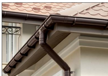
Водосточная система круглого сечения